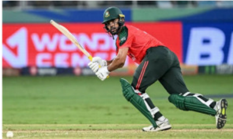
ওয়ানডে দলে প্রথমবার সাইফ, ফিরলেন সোহান