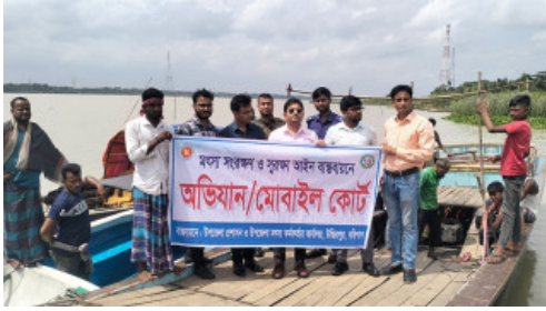
উজিরপুরে মা ইলিশ সংরক্ষণ অভিয়ানের প্রথম দিনে অবৈধ জাল উদ্ধার ও মা ইলিশ অবমুক্ত