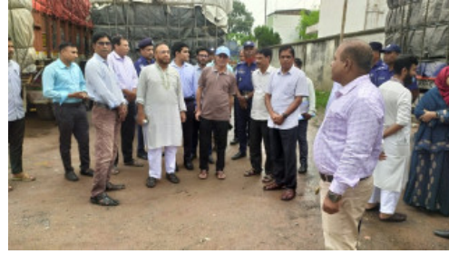
আমদানির পাশাপাশি রপ্তানিও বাড়াতে হবে : বিভাগীয় কমিশনার